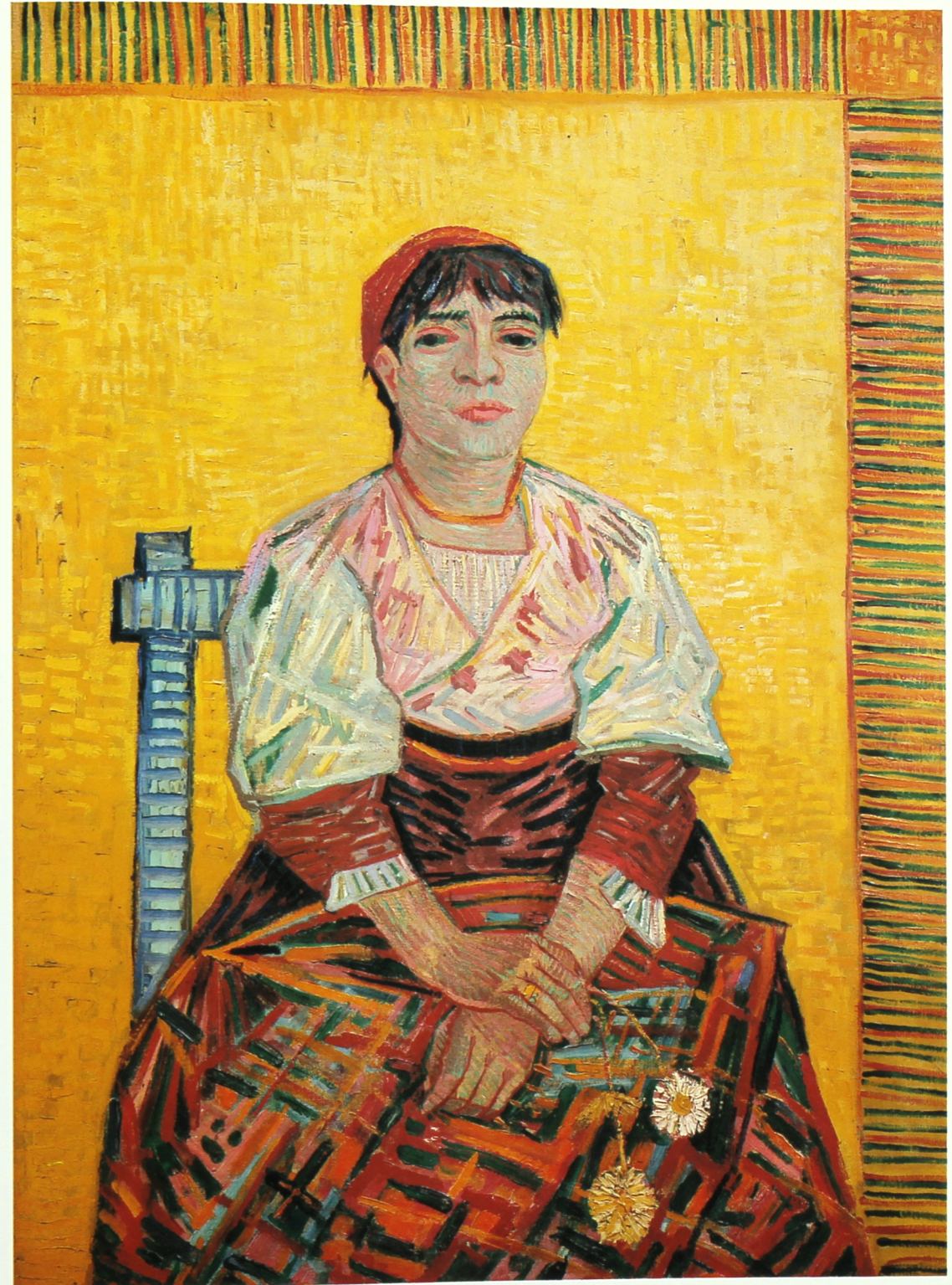
Portret van een vrouw met anjers , begin 1888, [1355] Olieverf op doek, 81 × 60 cm. Louvre, Parijs (Jeu de Paume)